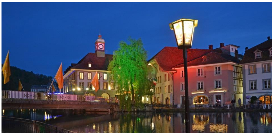
Вечернее освещение в дни празднования 750-летия присвоения Туну городских прав (2014)

Живописный исторический город Тун лежит на Тунском озере. Город называют воротами в Бернские альпы и швейцарской Венецией . Центр города пересекает река Ааре и каналы. Старинные здания на побережье реки и каналов встают как будто прямо из воды. Город предлагает множество исторических архитектурных памятников, таких как Тунский замок XIII века, единственную в Европе средневековую торговую улицу с двухэтажными тротуарами и сохранившийся облик центральной части города. В Туне работают современные предприятия, успешно реализуется программа по использованию солнечной энергии в индивидуальном строительстве и для вечернего освещения города.