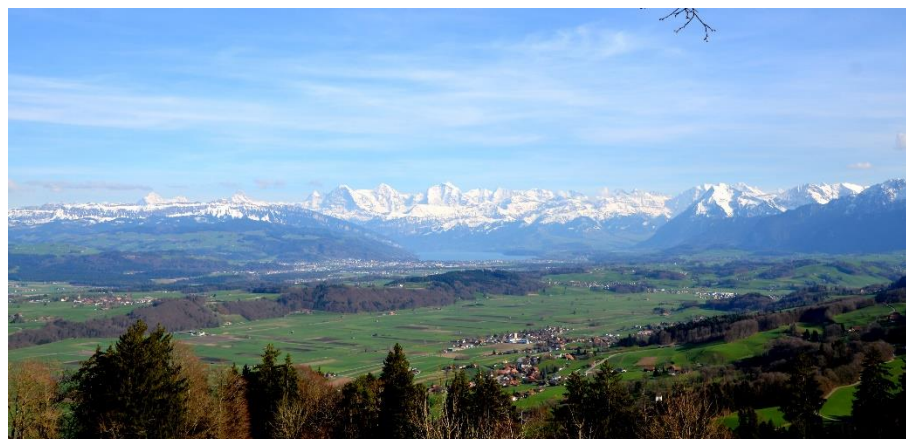
В окрестностях Циммервальда